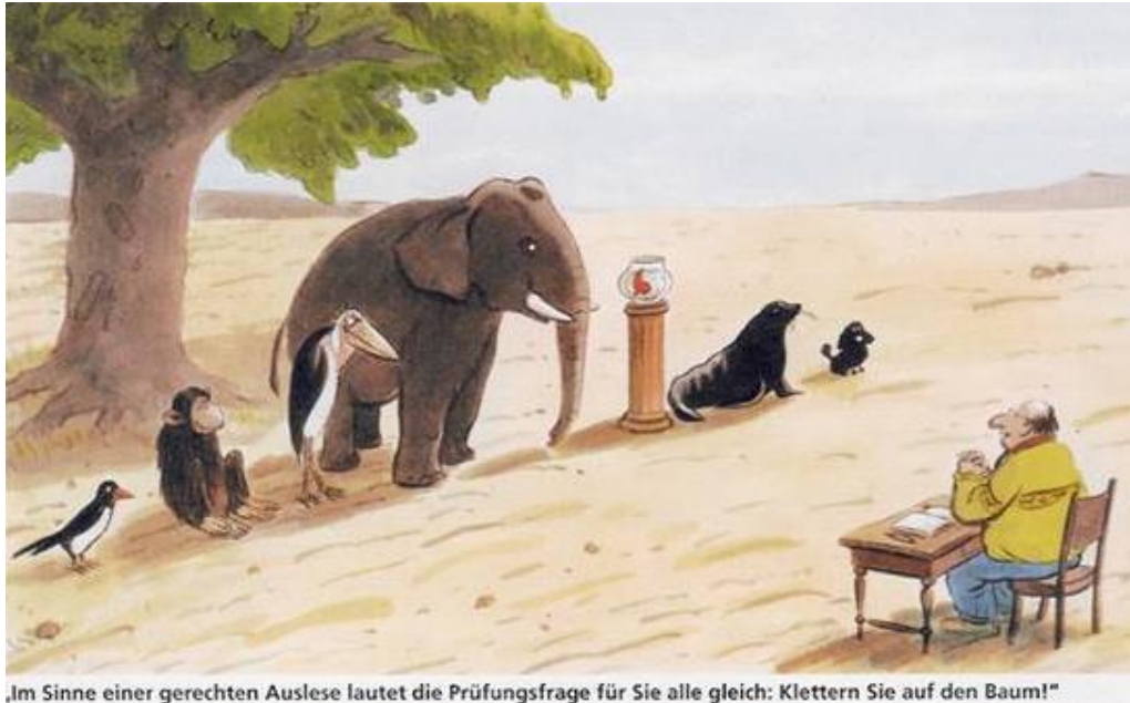
„Im Sinne einer gerechten Auslese lautet die Prüfungsfrage für Sie alle gleich: Klettern Sie auf den Baum!“

In der Elise von König Gemeinschaftsschule arbeiten die Kinder: